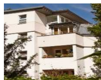
HEERSTRASSE BERLIN WESTEND