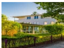
LICHTERFELDER RING BERLIN LICHTERFELDE