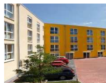
NEUSTADT AM RÜBENBERGE